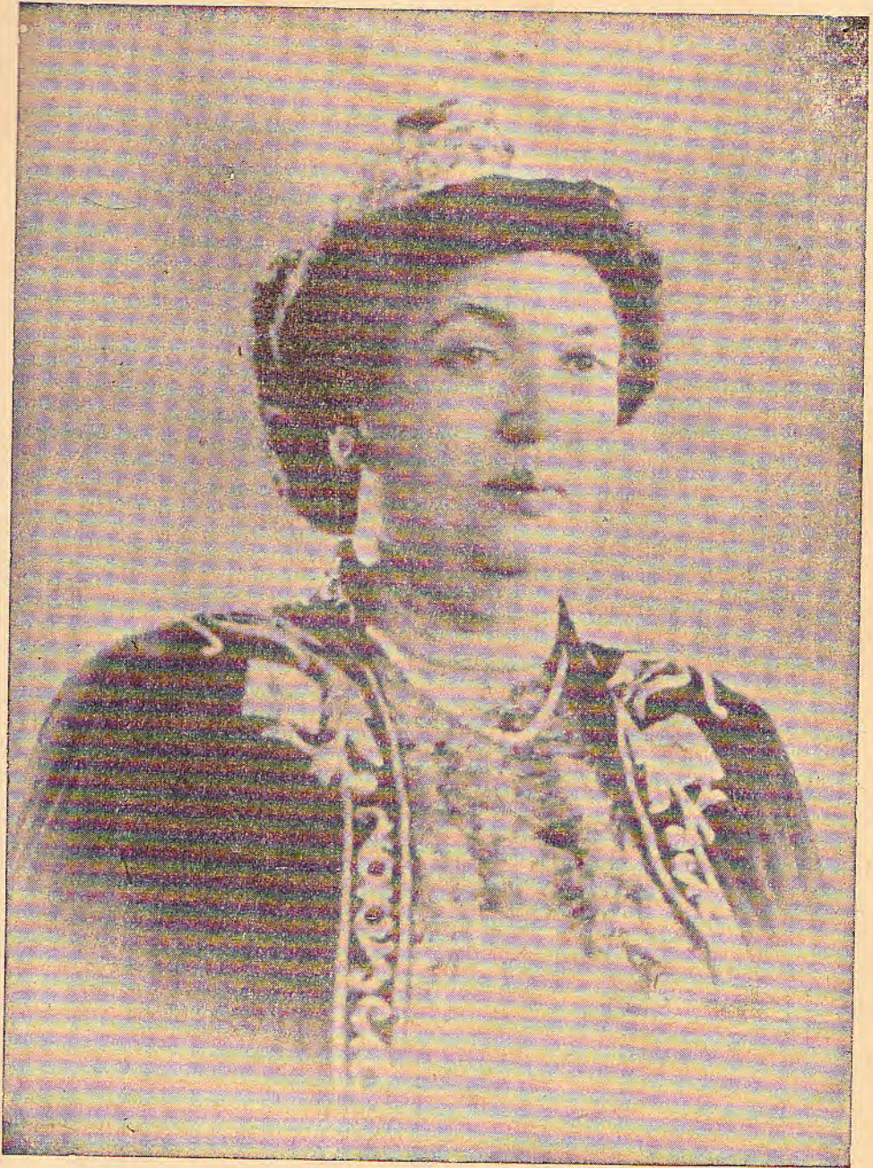
ገርማዊት አቲጊ መነን ።