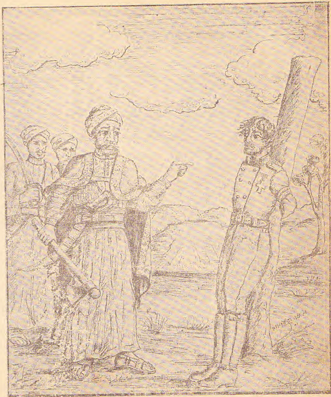
ክርስቶስ ሮሮስ : ደገማ : ለገደል : በግራኝ : መሐመድ : ፊት : አንደ : ታስረ : (በመላ : የገማስ)