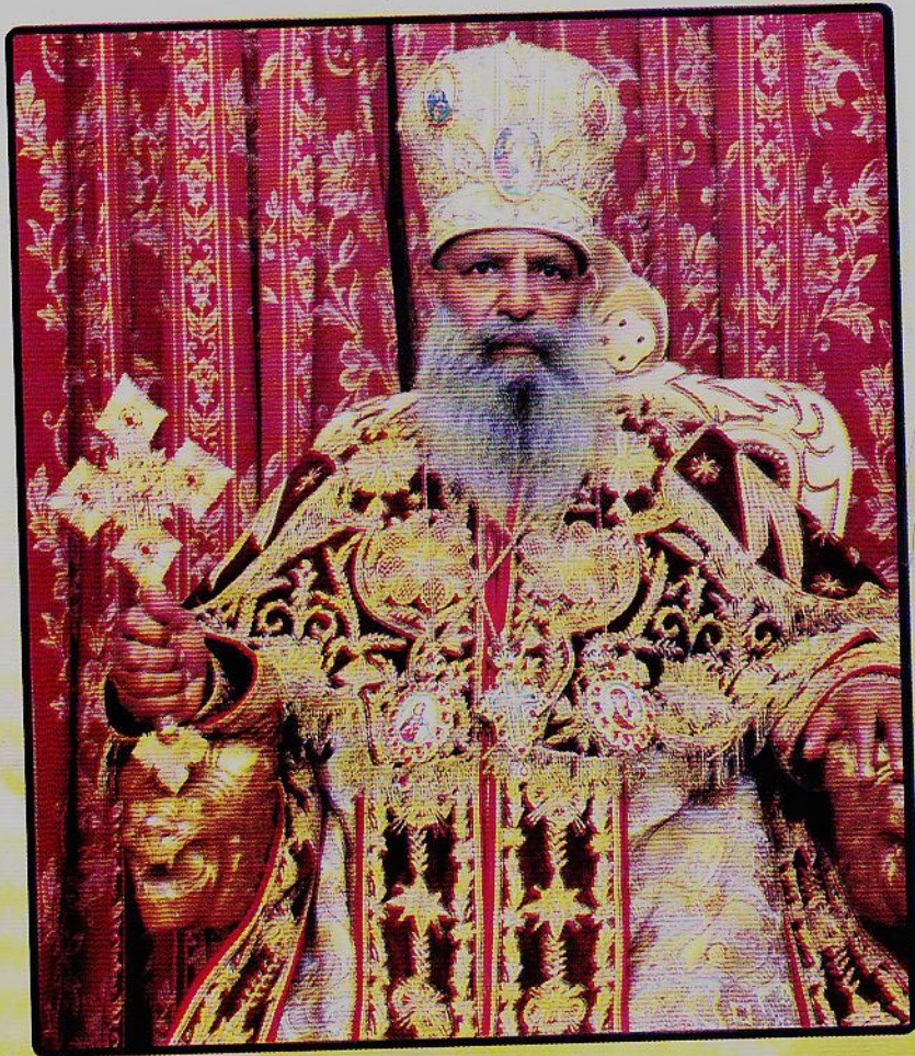
በፁዕ ወቅዱስ አቡነ ማጥያስ ቀዳማዊ ፓትርያርክ ርዕሰ ሊቃነ ጳጳሳት ዘኢትዮጵያ ሊቀ ጳጳስ ዘአክሱም ወእጩጌ ዘመንበረ ተክለሃይማኖት አዲስ አበባ