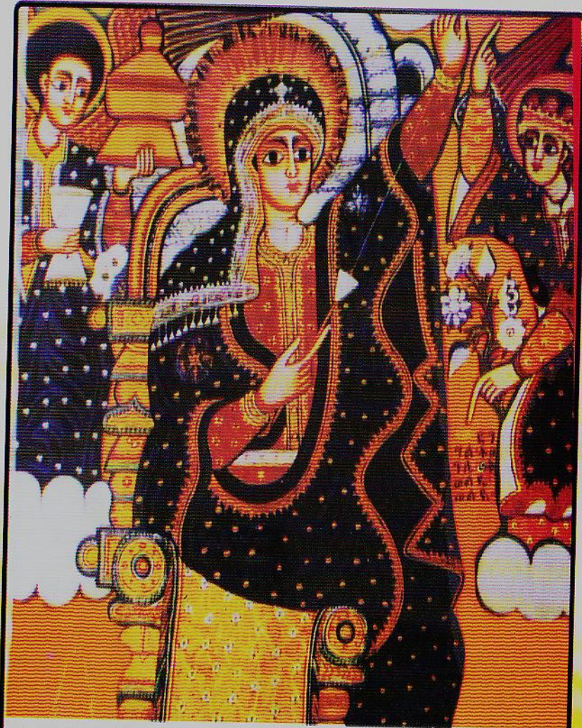
በግሸን ደብረ ክርቤ ቅድስት ማርያም የምትገኘው የእመቤታችን «ወእንዝ ትፈትል ሥዕል» ማለትም እመቤታችን የቤተ መቅደስ መጋረጃ የሚሆን ሐርና ወርቅ እያስማማች ስትፈትል መልእኩ ቅዱስ ገብርኤል እንዳበሠራት