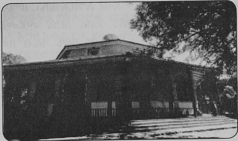
በግሽን ደብረ ክርቤ የቅድስት ማርያም ቤተክርስቲያን