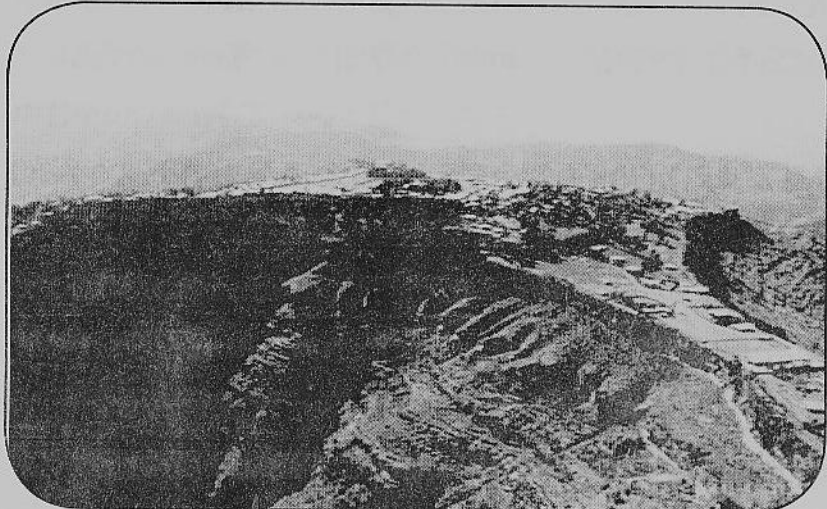
የግሽን ደብረ ክርቤ ተራራ ከላይ ወደታች ሲታይ

ግሽን ደብረ ክርቤ ቅድስት ማርያም በደቡብ ወሎ ሀገረ ስብከት በአምባሰል ወረዳ ከደሴ ከተማ 82 ኪ/ሜ ርቃ ከፍ ብሎ በሚታይ መስቀለኛ ተራራ ላይ ትገኛለች። በአቅራቢያዋም ከሚገኙ በርካታ ታሪካውያንና ጥንታውያን መካከት መካከልም ጥንታዊው የደብረ ሐይቅ አቡነ ኢየሱስ ሞግ ገዳም፣ የድጓ ምስክር የነበረው ደብረ እግዚአብሔር፣ የቅኔ ትምህርት ምንጭ የሆነው ዋድላ/ደላንታ፣ የ19ኛው ክፍለ ዘመን የሃይማኖት ውሳኔ የተደረገበት የቦሩ ሜዳ ሥላሴ፣ የውጫሌ ውል የተፈረመበት የውጫሌ ከተማ፣ የመቅደላ አምባ፣ የበሽሎ ወንዝ ሽለቆና ሌሎችም ናቸው።