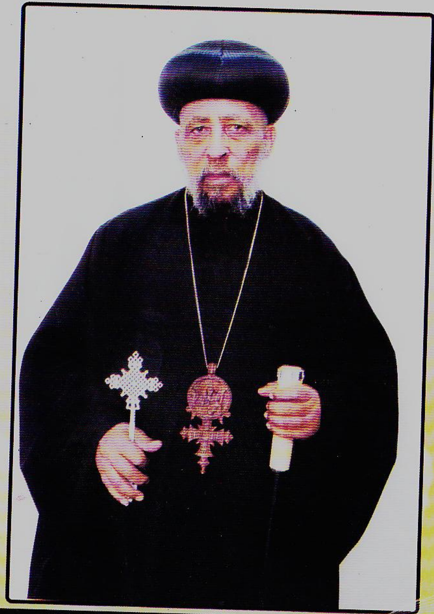
በፁዕ አቡነ አትናቴዎስ የደቡብ ወሎ ሀገረ ስብከት ሊቀጳጳስ የቅዱስ ሲኖዶስ-አባል