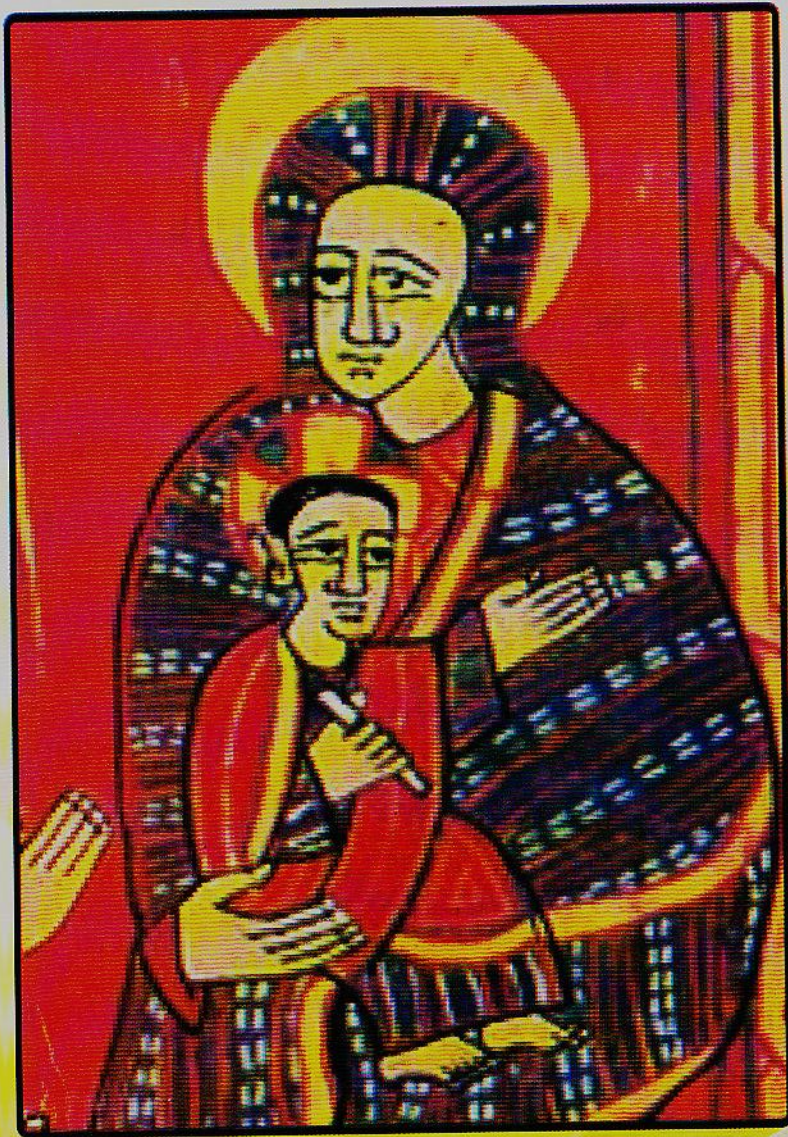
ምስለ ፍቁር ወልዳ በግሸን ደብረ ክርቤ ቅድስት ማርያም ብቻ ከሚገኘው ከመጽሐፈ ጤፋት የተወሰደ የ15ኛው መቶ ክፍለ ዘመን ሥዕል