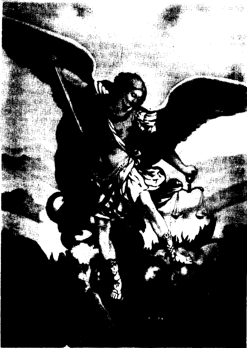
ዝ ውእቱ ሚካኤል ዘነፅኖ ለዕቡዮ ኅሊና .....