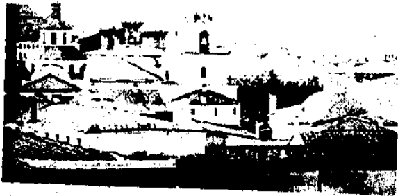
ጥስካ (ሩሲያ) የሚገኝ የቅዱስ ዮሐንስ አፈ ወርቅ ገዳም (1882)

አንድ ስለ እርሱ ዜና ሕይወት የጻፈ ከእርሱ ጋር ዘመን ገጠም የነበረ ጸሐፊ እንዲህ አለ፡- «ለሰው ልጅ ትምህርትና ጥቅም ይህን ዘንድ፤ እንዲሁም ታላቅ በሆነው የኢየሱስ ቀዳሳነት ተግባር የሚሰማሩ ሁሉ ቅዱስ ዮሐንስ አፈወርቅን አርአያቸው ያደርጉት ዘንድ ስለ እርሱ የሰማሁትን ግግር ብራና ላይ በብዕር እጽፋለሁ፡፡» አንድ ሌላም የእርሱን ትምህርቶች ደህና አድርጎ ያነበበ ሰው፤ በዚህም ያገኘውን ጠቀሜ እና ያሳደረበትን መልካም ተጽእኖ ሲገልጽ፡- «አንድ ሺህ በላይ የሚሆኑ የእርሱን ትምህርቶች አንብቤአለሁ፤ ከእነዚህም ከውስጣቸው ሲገለጹ የማይቻል ልዩ ጣዕም ይፈልጋል፡፡ ከሕፃንነቱ ጀምሮ እርሱን በማወቁ በጣም ደስ ይለኛል፡፡ ድምፁን የምሰማውም እንደ እግዚአብሔር ድምፅ አድርጌ ነው፡፡ እኔ ላወቅኩትና ለሆንኩት ሁሉ አመሰግንዋለሁ» ብሏል፡፡ 60