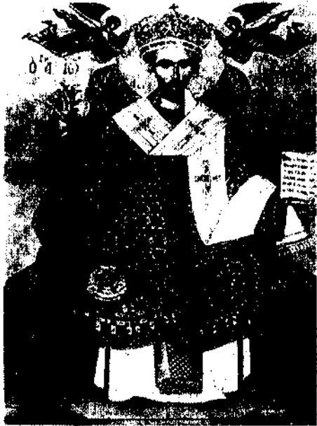
ቅዱስ ዮሐንስ አፈ.ወርቅ-በቁስጥንጥንያ መንበር ላይ ሲሾም የግያላይ ሥዕል

ይኸ ለውጥ ድንገተኛ የመሆኑን ያህል ከባድም ነበር። ምቹትና ድለት የዕለት ተዕለት ሕይወት በሆነበት፣ ኃጢአትና ግፍ እንደ ቀላል በሚታዩበት፣ በሰው ደምና ሕይወት ተረማምዶ ወደ ሥልጣን መውጣትና ሥልጣንን ማስጠበቅ የጀግንነት መገለጫና ጀብድ ተደርገው በሚወሰዱበት ቤተ መንግሥት አጠገብ መሾም ቀላል ነገር አልነበረም።