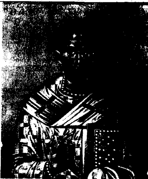
የቅዱስ ዮሐንስ አፈወርቅ የግሪክ ሥዕል

እርሱም በመንበረ ጽጵስናው ውስጥ ተወስኖ እያለ ሁለት ጊዜ ከተቃጣበት የመግደል ሙከራ ተረፈ። በመጀመሪያ አንድ ርኩስ መንፈስ ያደረበትና አእምሮውን የሳተ የመሰለ ሰው የተሳለ ሳንጃ ይዞ ቅዱስ ዮሐንስ አፈወርቅን ለመግደል ሲሮጥ ሳለ በሕዝቡ ተይዞ ሰከተማው ሹም ተሰጠ። ቅዱስ ዮሐንስ አፈወርቅ ግን ጳጳሳትን ልኮ በግርፋትና በሰቃይ ከመመርመሩና ከመጠየቁ በፊት እንዲፈታ አደረገው። ሌላም ሰው እንዲሁ ስለት በስውር ይዞ የሮጠ በመሄድ ሲይዘው ያለውን ሰው ሁሉ የወጋ የጣለ ወደ መንበረ ጽጵስናው በመሮጥ ሊገድለው ሲል ሕዝቡ በጭንቅ ይዞ አስቀረው።