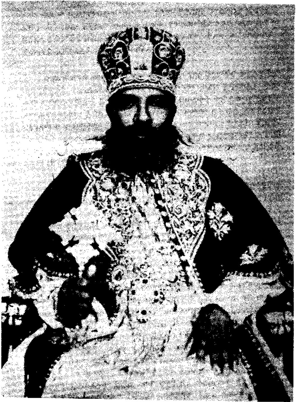
ብፁዕ ወቅዱስ ኦቡነ ጳውሎስ ፓትርያርክ ርእሰ ሊቃነ ጳጳሳት ዘኢትዮጵያ ወእጩን ዘመንበረ ተክለሃይማኖት