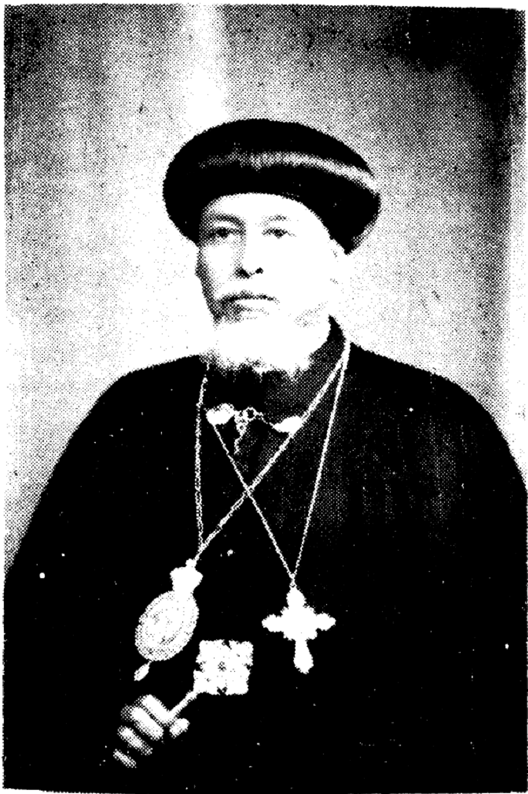
በፀ.ዕ.፡ ወቅ.ዱ.ሰ.፡ አዙ.ኑ.፡ ዓስልዮ.ሰ.፡ ርእሰ.፡ ሊ.ቃ.ኑ.፡ ጳጳሳት.፡ ወ.ፓ. ተረ.ዖርክ.፡ ዘአ.ተ.ዮ.ጳ.ዮ.፡ ገጽ.፡ (፲፯፻፮.፡ ፲፱፻፱) =