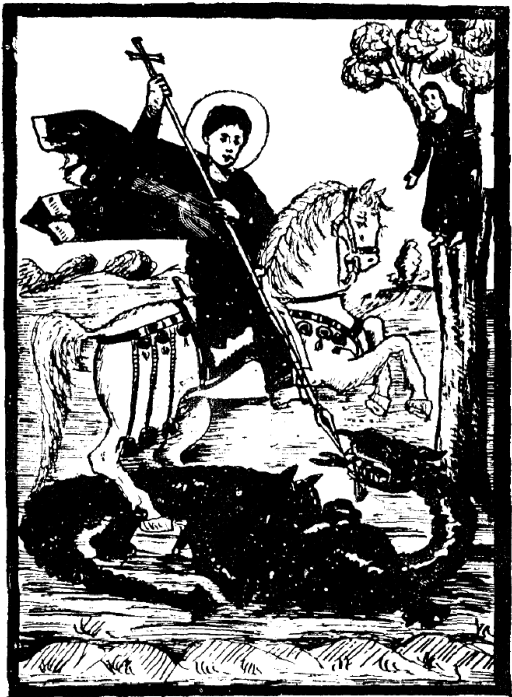
Քրիստոսի շնորհակալությունը (18 • ԸՂՂԶԿ • ԸՂԸԶ)