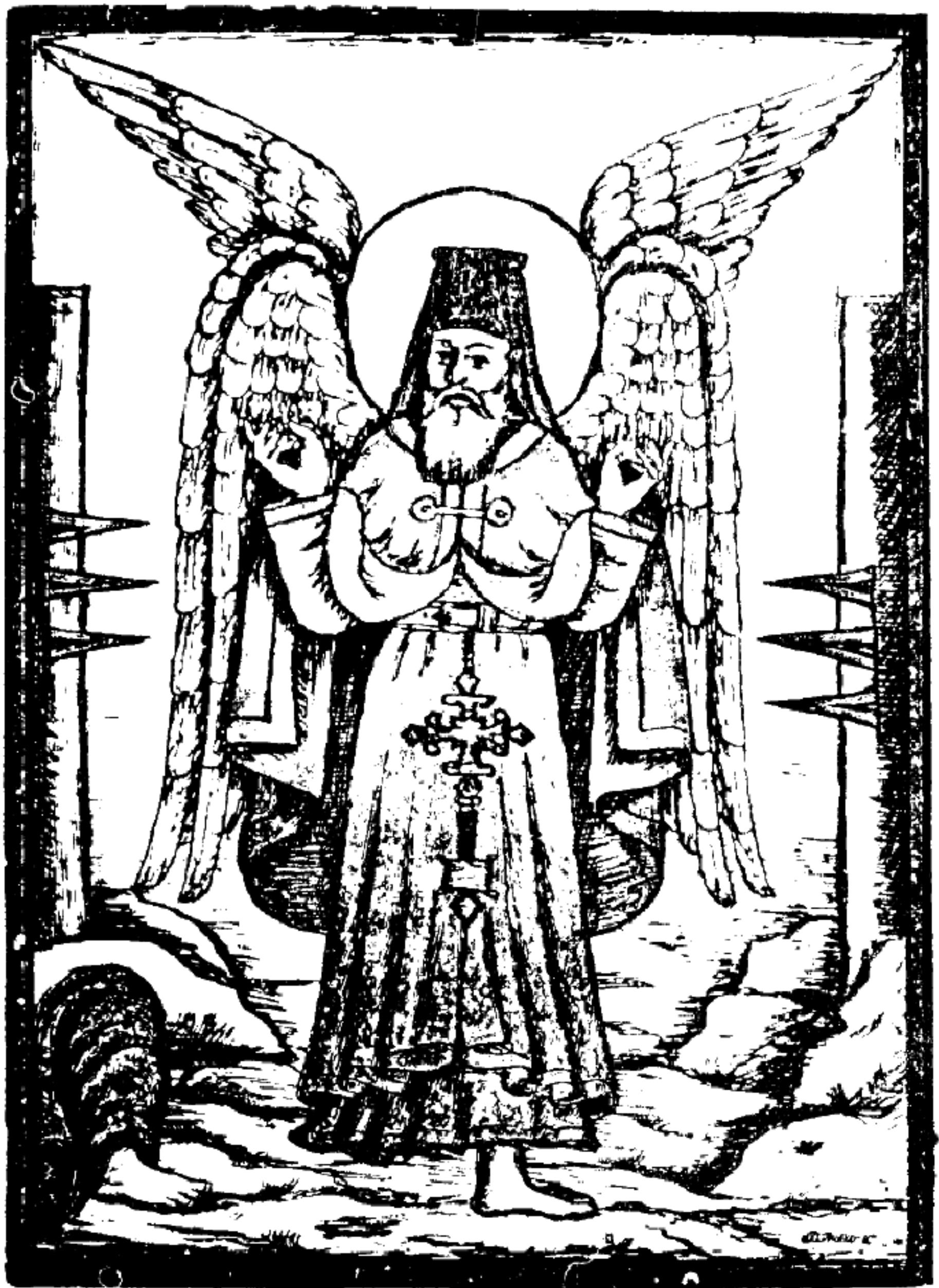
ԱՌՆ՝ ԿԻՆ՝ ՎԵՊԳԴ՝ (ԴՔ՝ ԸՆՊԶԳ՝ ԸՆԶԶ) Բ