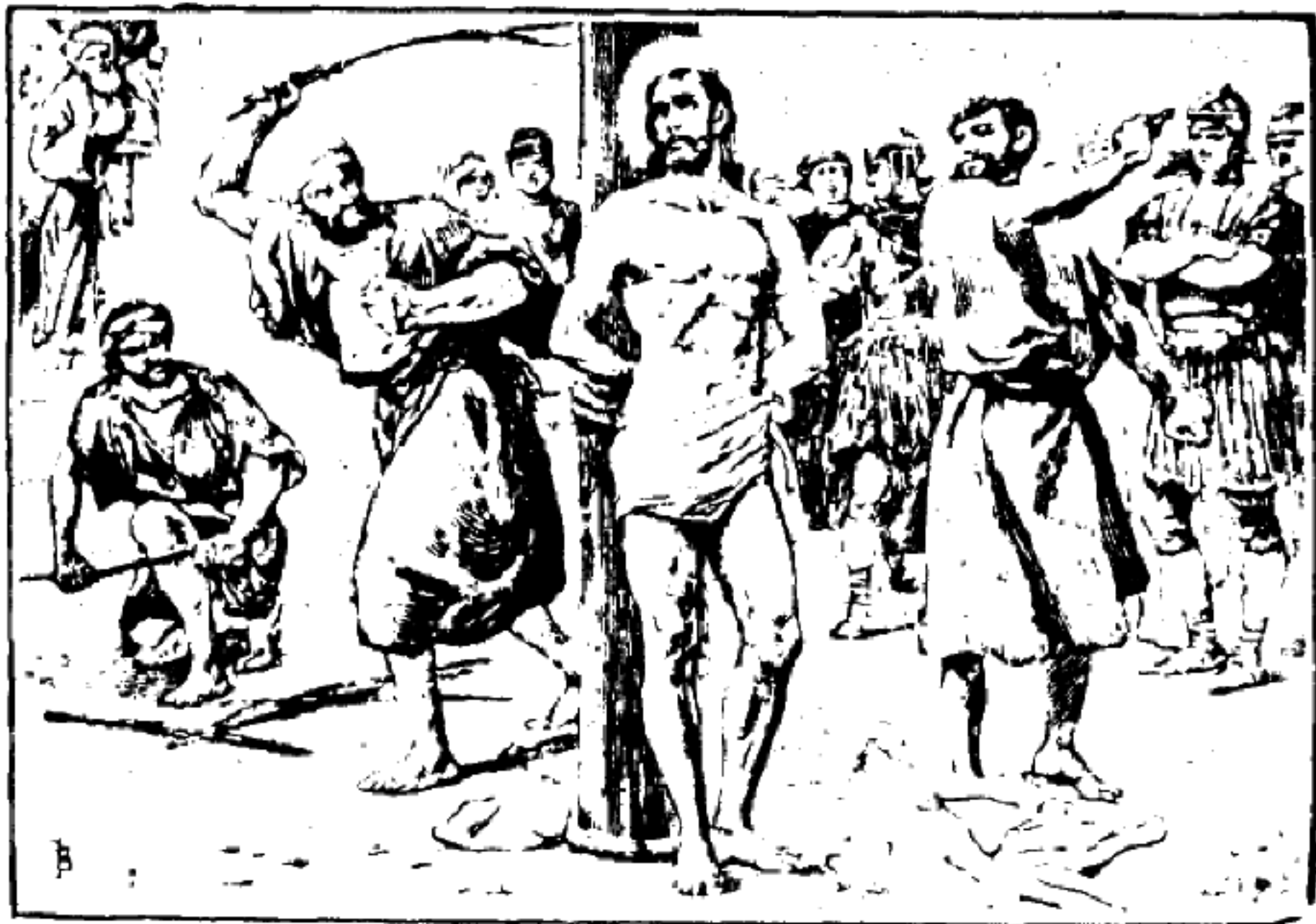
ተቀሥፎተ ፡ ዘባነ ፡ ለእግዚእነ ።